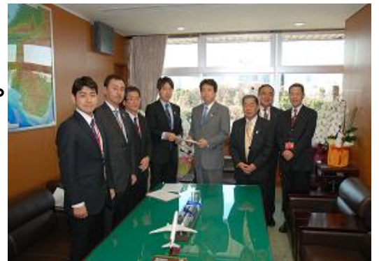
2月20日 鶴保国交副大臣へ要請